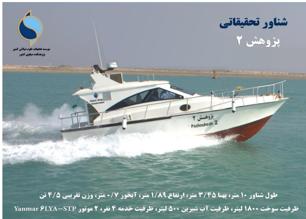
شکل ۲- قایق تندرو پژوهش ۲- متعلق به پژوهشکده میگوی کشور.