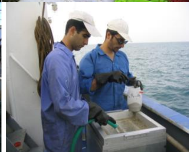
شکل ۱- کشتی فردوس - ۱ متعلق به پژوهشکده میگوی کشور.