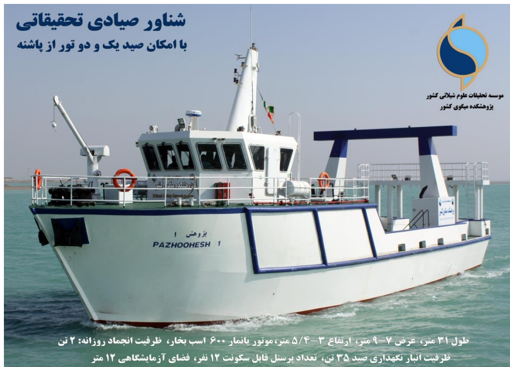
شکل ۲- کشتی پژوهش ۱- متعلق به پژوهشکده میگوی کشور.